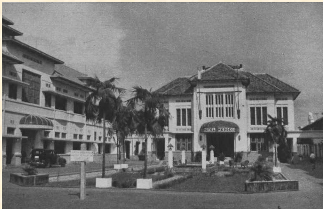
Voor en achter de coulissen van de republiek! Hoe goed verzorgd het plantsoentje voor het hotel Merdeka te Djokja er uitzag, waar de buitenlandse gasten kwamen ....