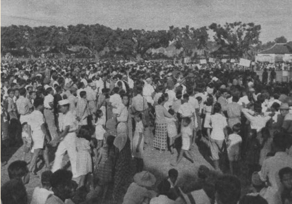
Hoe goed gekleed en welvarend de bevolking van Djokja er uitzag vergeleken