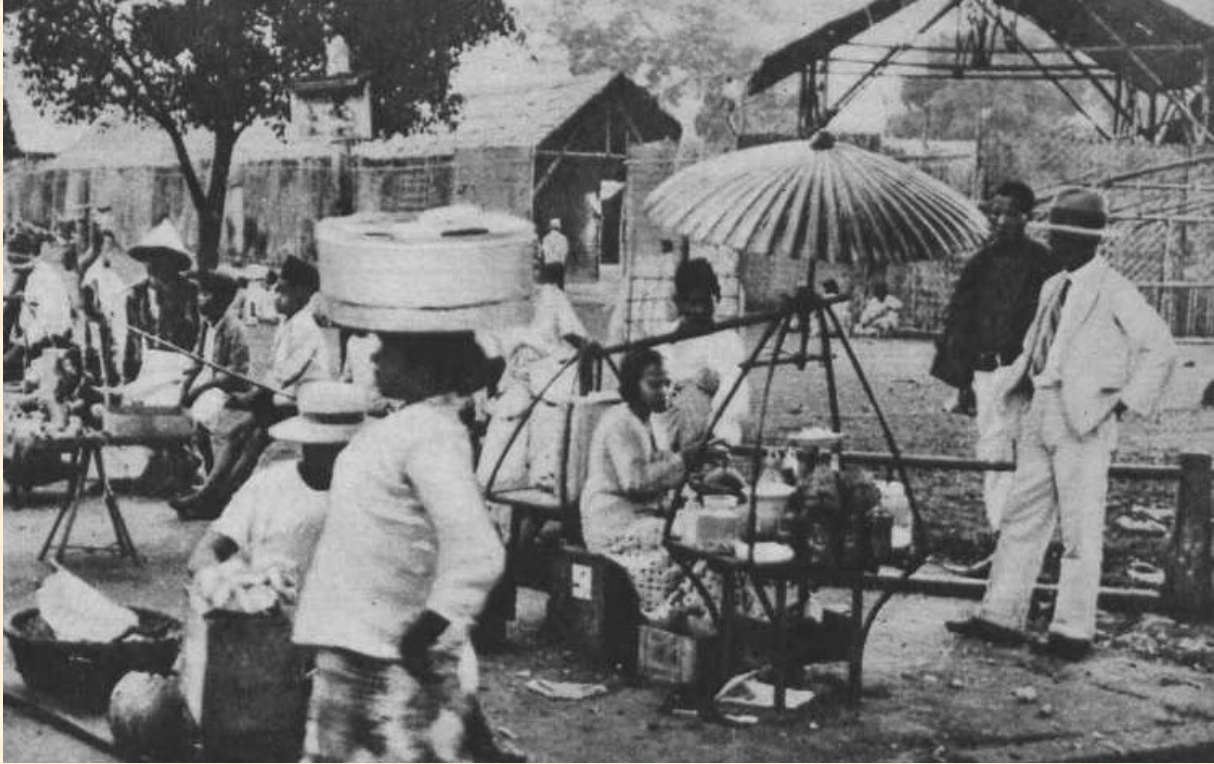
Een levendig tafereeltje op de pasar te Djokja, waar nog van alles te koop was.