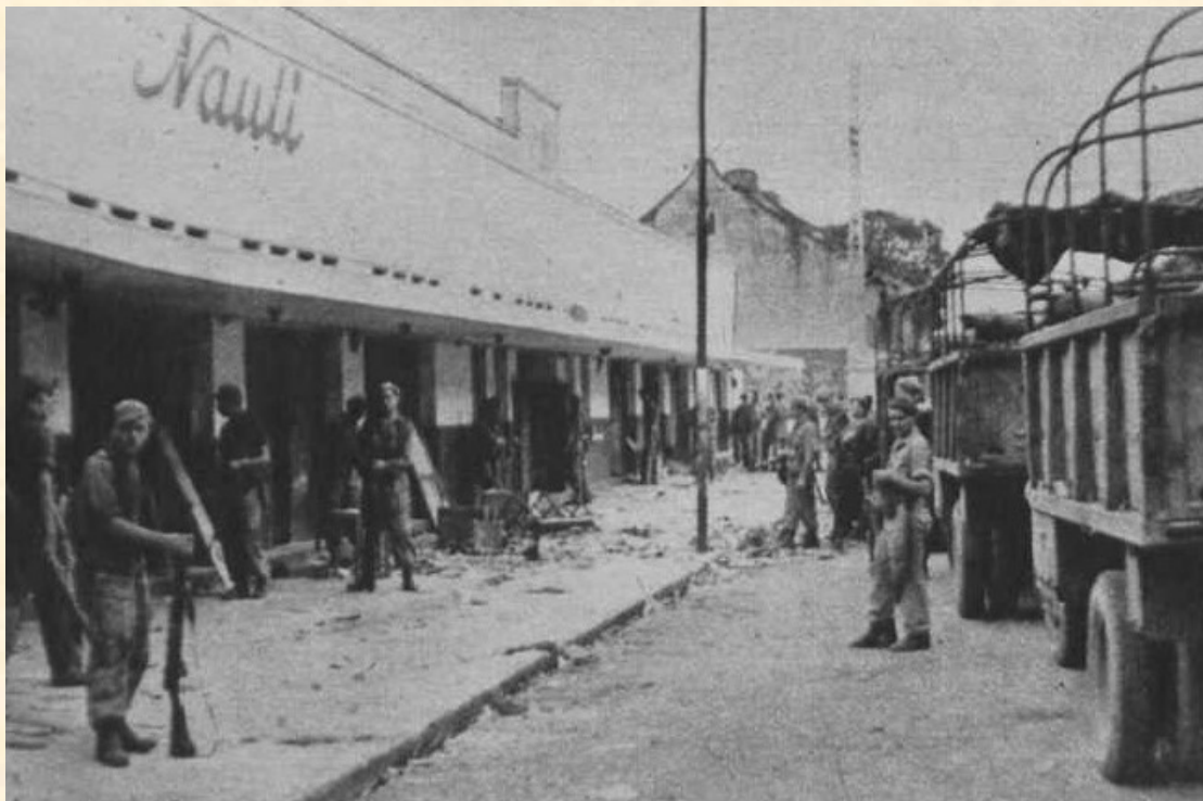
en een straat in Solo met leeg-gerampokte winkels en huizen, die geen vreemdeling ooit te zien kreeg!