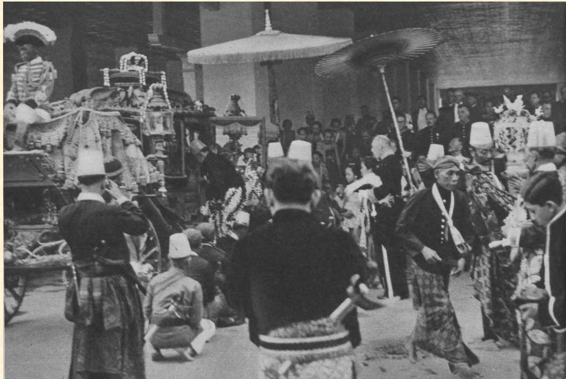
Voormalige luister in de vorstenstad Solo. De soesoehoenan van Soerakarta verlaat de kraton (het paleis) en stapt in zijn staatsierijtuig, terwijl de paleisbedienden eerbiedig neerhurken. In het midden van de foto de Nederlandse resident.